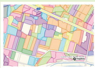
農業委員会サポートシステムを使用