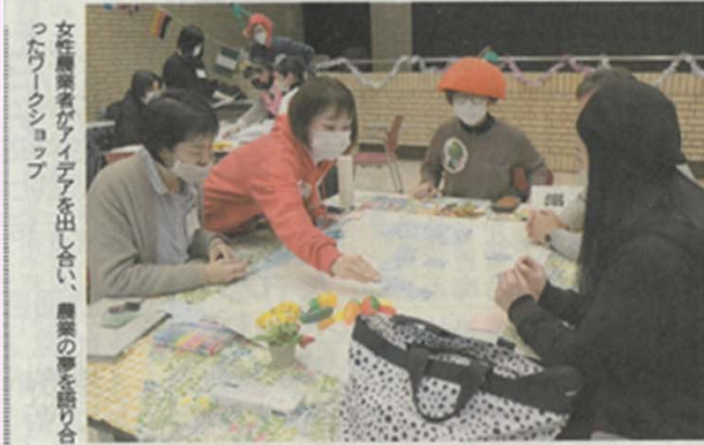
女性農業者がアイデアを出し合い、農業の夢を語り合ったワークショップ