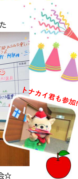
トナカイ君も参加!