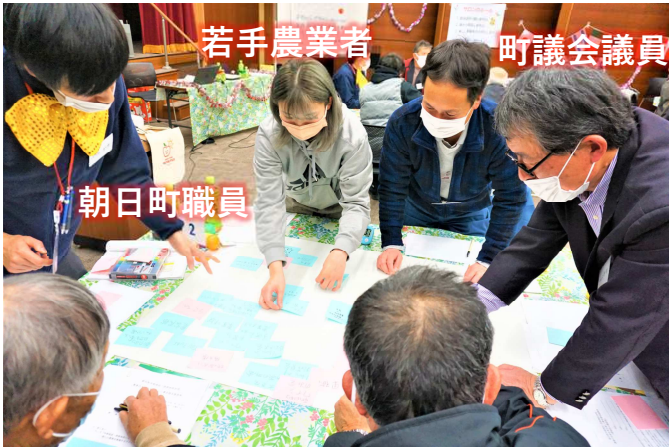
若手農業者 町議会議員

まずは、個人でふせんにアイデアを出して、その後グループでアイデアを3つに絞ります