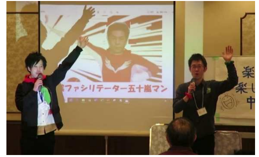
↑山形県農業会議職員のショートコント！