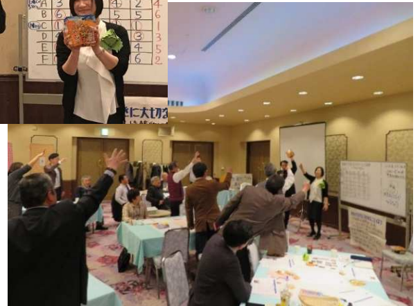
↑恒例のじゃんけん大会で富士宮焼きそばをゲット！ (本当に美味しいです ✨) 山形では手に入りませんよ～