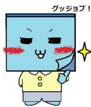
ファシリテーター研究会(仮) キャラクター:フセンくん→