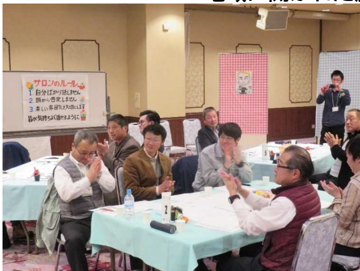
↑ 雰囲気づくり が大切なんです！！ いいことを言ったら拍手！！