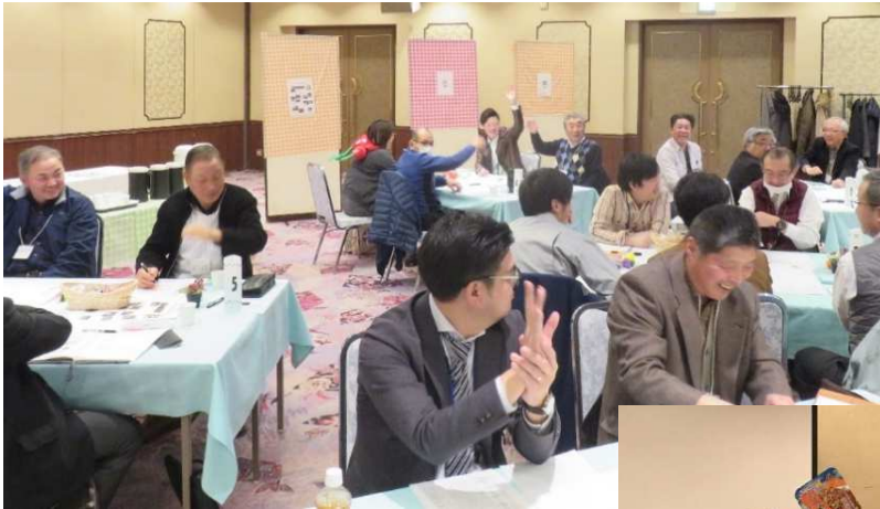
↑「人を動かすには？」答えが3番だと思う人！ ……はすれですよ(笑)