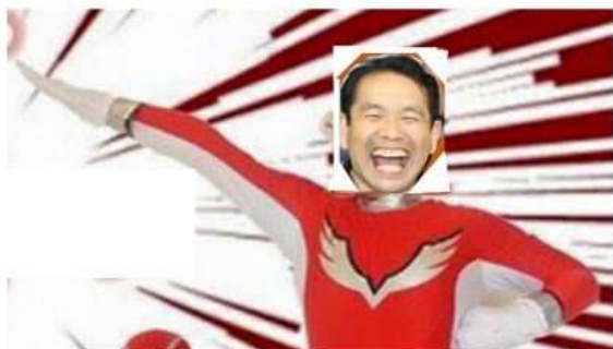
農業ファシリテーターマン

発行：(一社)山形県農業会議 やまがたファシリテーター研究会(仮) 令和2年2月21日発行